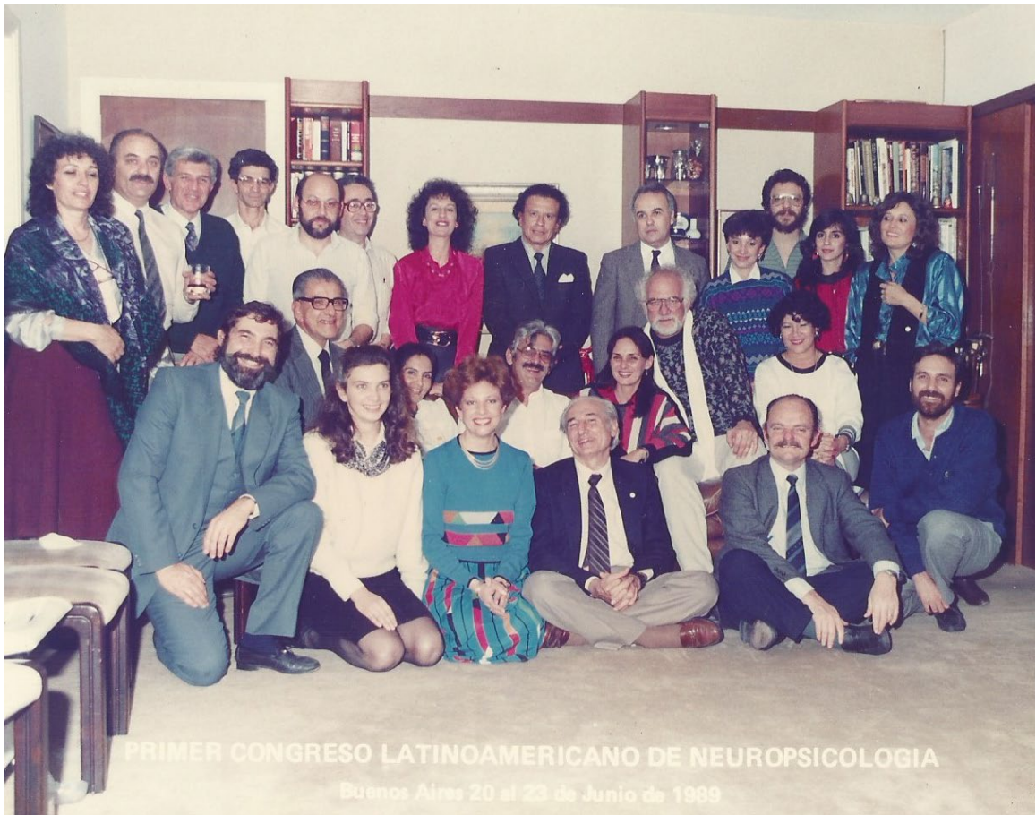
Nota. Primer Congreso Latinoamericano de Neuropsicología, Buenos Aires, 20 al 23 de junio 1989.